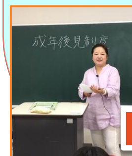
社会資源活用論 @深谷大里看護専門学校